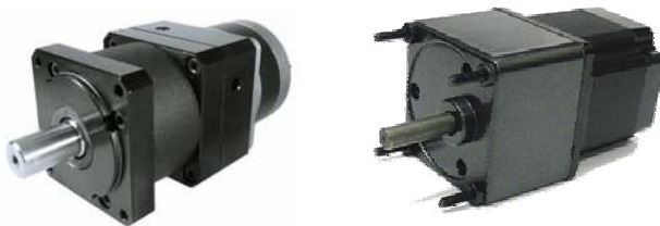
Mit verschiedenen Planetengetrieben erhältlich