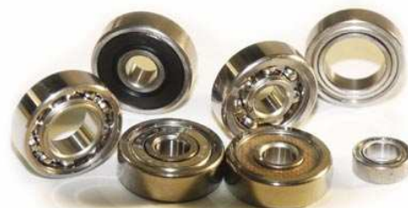
Sonderlager: Hochtemperatur möglich, Vakuum Umgebung, Lager aus rostfreiem Edelstahl