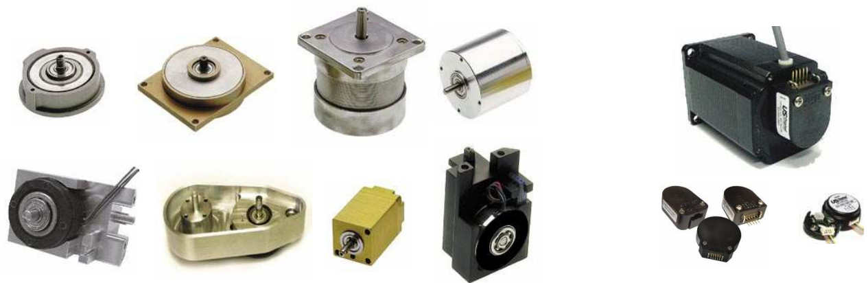
Kundenspezifische Gehäuse, Reinraumanwendung, rostfreier Edelstahl,